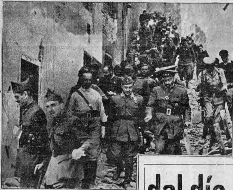
El generalísimo de las fuerzas nacionalistas, General Franco, escucha el primer informe auténtico del sitio del Alcázar; rodea el informe el propio comandante de los valientes cadetes, el ahora general José Moscardó.—Rodea a los generales Franco y Moscardó la oficialidad que dirigió la ofensiva contra Toledo.

Apoya este ataque un brusco avance desde Toledo por las direcciones de Bargas y Mocejón.—Después de un día de intensa preparación con fuego de artillería las tropas de asalto se lanzaron sobre las posiciones gubernistas deteniendo la contraofensiva