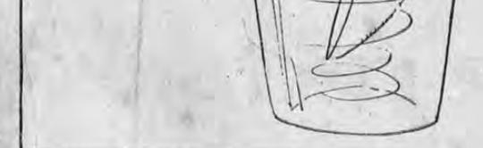
—¡Habrá que esperar a que se asiente todo ese revoltijo para ver en qué para esto!

A pesar de los buenos precios que obtienen los productos de exportación la circulación monetaria en el comercio es nula.